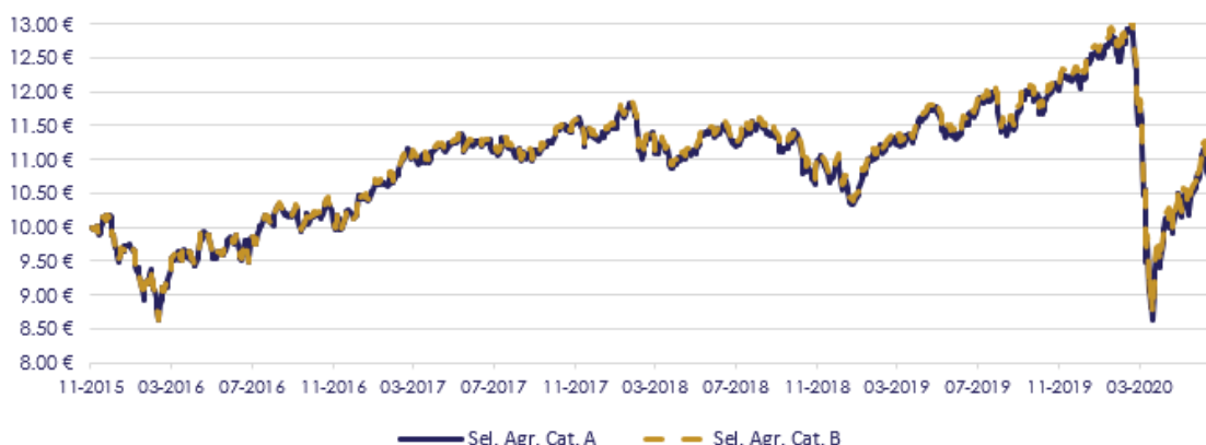
GRÁFICO DE EVOLUÇÃO COMPARADA DESDE INÍCIO DO FUNDO

O fundo não adota parâmetro de referência.