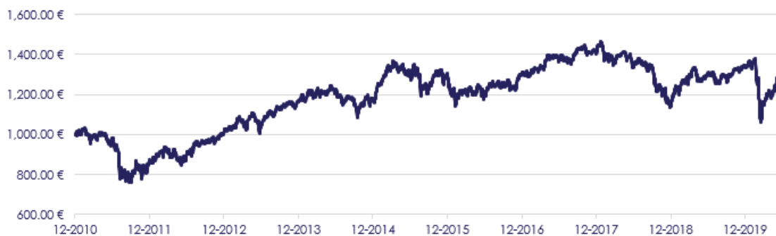
GRÁFICO DE EVOLUÇÃO COMPARADA DESDE INÍCIO DO FUNDO

O fundo tem como parâmetro de referência a Taxa Euribor a 12 meses acrescida de 400 pontos base.