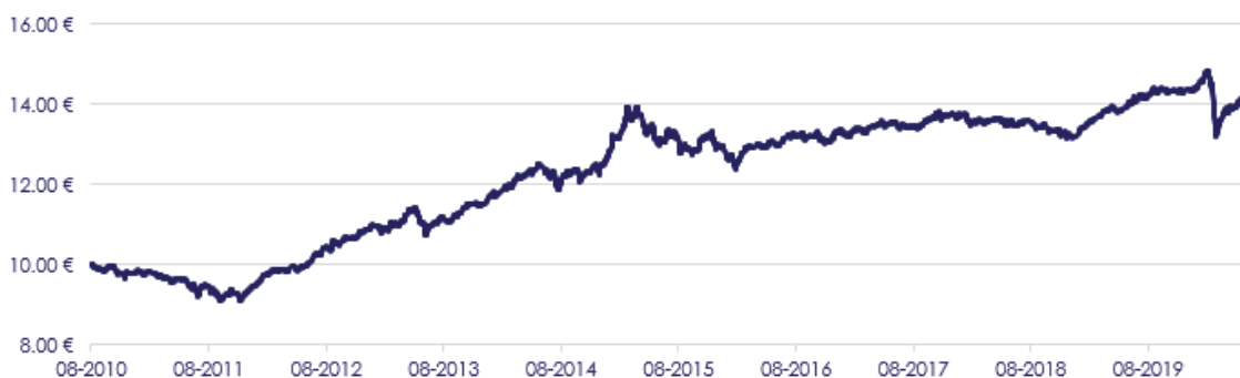
GRÁFICO DE EVOLUÇÃO COMPARADA DESDE INÍCIO DO FUNDO

O fundo não adota parâmetro de referência.