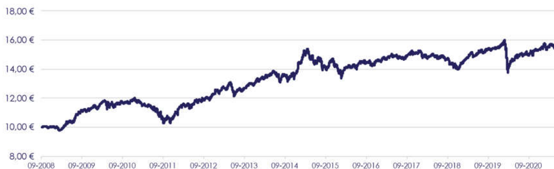
GRÁFICO DE EVOLUÇÃO COMPARADA DESDE INÍCIO DO FUNDO

O fundo não adota parâmetro de referência.