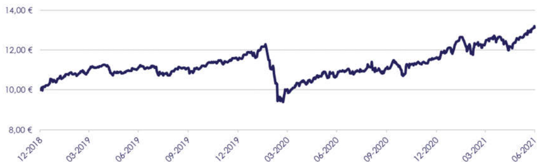
GRÁFICO DE EVOLUÇÃO DESDE INÍCIO DO FUNDO

O fundo não adota parâmetro de referência.