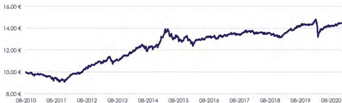
GRÁFICO DE EVOLUÇÃO COMPARADA DESDE INÍCIO DO FUNDO

O fundo não adota parâmetro de referência.