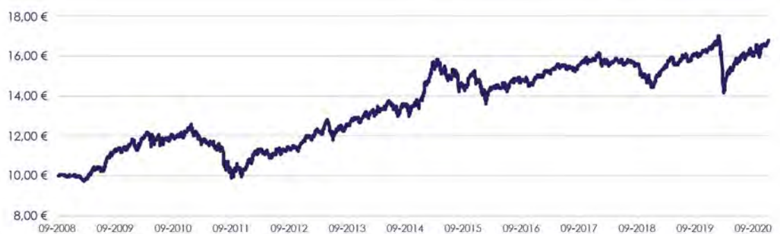
GRÁFICO DE EVOLUÇÃO DESDE INÍCIO DO FUNDO

O fundo não adota parâmetro de referência.