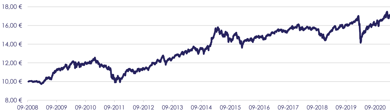
Gráfico de Evolução do Valor das Unidades de Participação em Euros, desde a Criação do Fundo